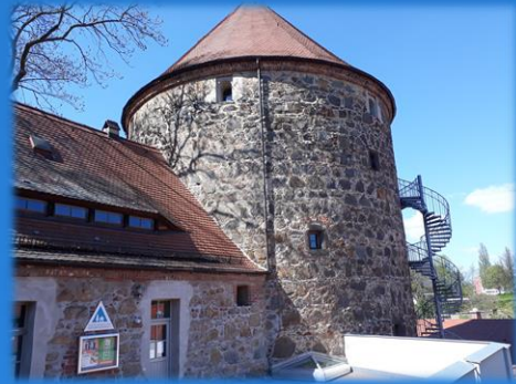
Tagungsort Jugendherberge „Gerberbastei“